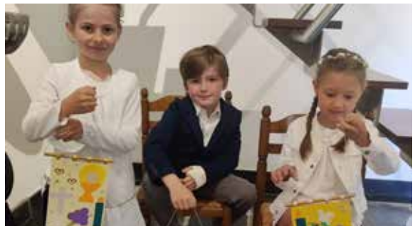
Premiers communiantes Remouchamps