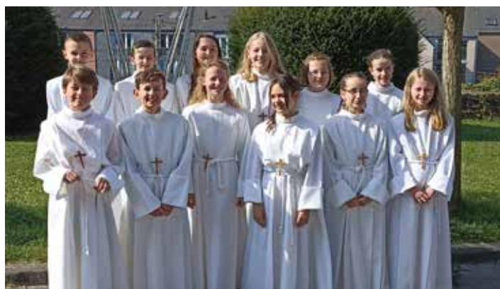
Professions de foi Sprimont