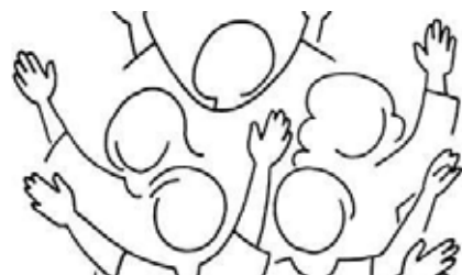
Professions de foi Aywaille*