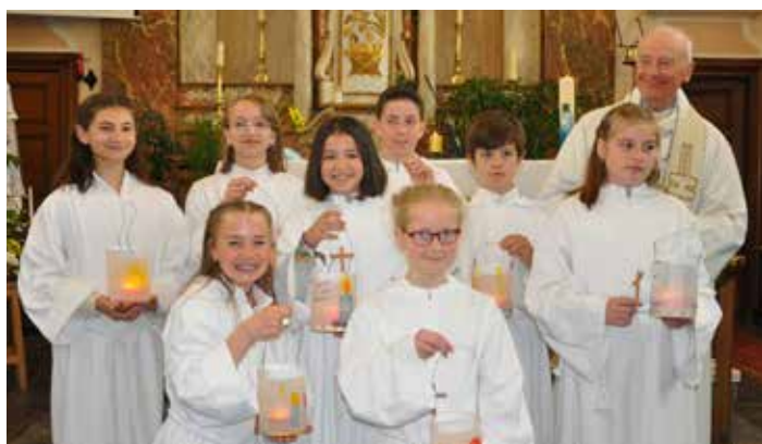
Professions de foi Dolembreu