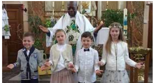
Premiers communiantes Dolembreu