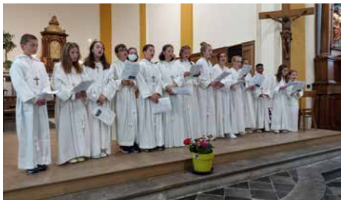
Professions de foi Banneux-Louveigné