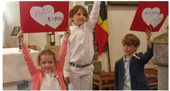
Premiers communiantes Florzé