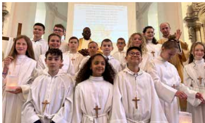
Professions de foi Remouchamps