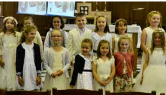
Premiers communiantes Sprimont