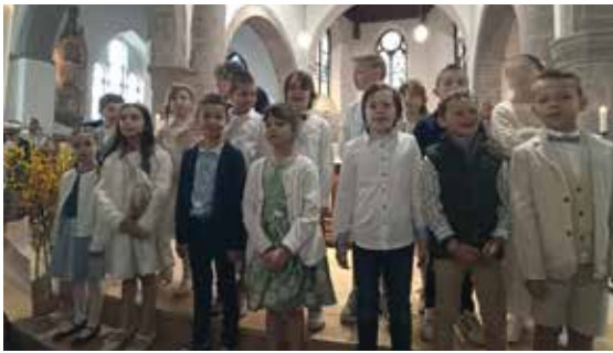
Premiers communiantes Aywaille