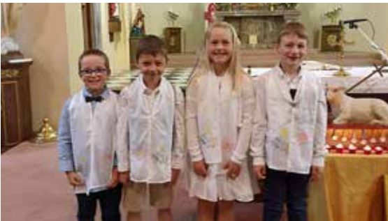
Premiers communiantes Awan